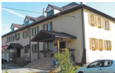
Gminne Centrum Kultury w Drelowie